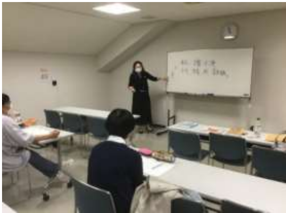
講師:じゃあじゃあ先生